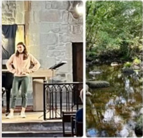
28 juil.- 1er août 2025 Royère de Vassivière « Master class »